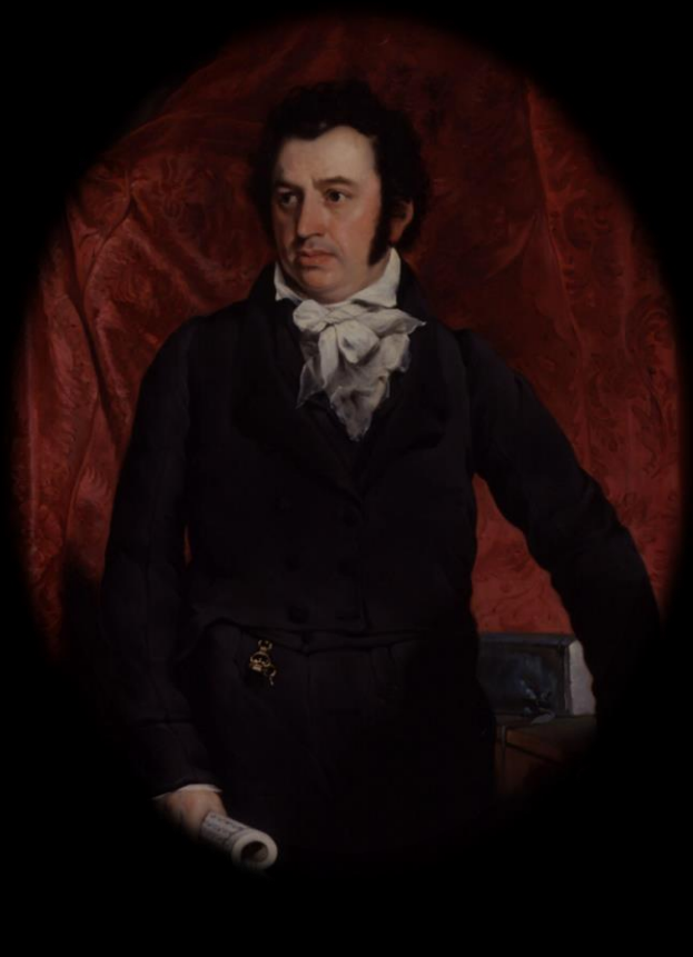
马礼逊 第一位来华 更正教 宣教士