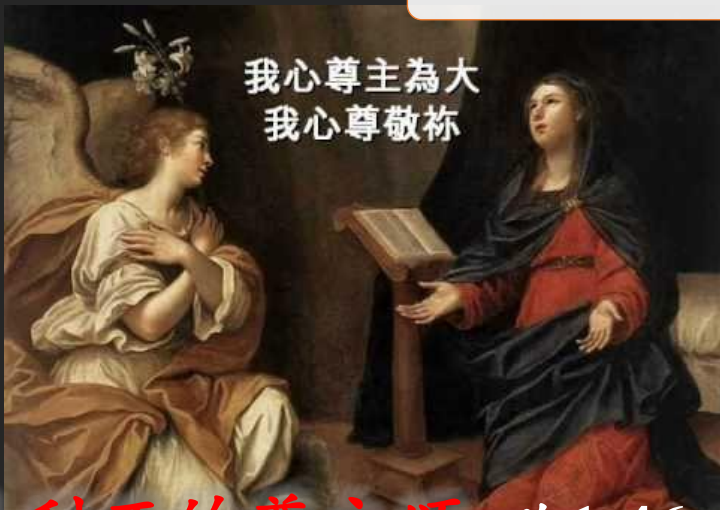
马利亚的尊主颂 路1:46~55