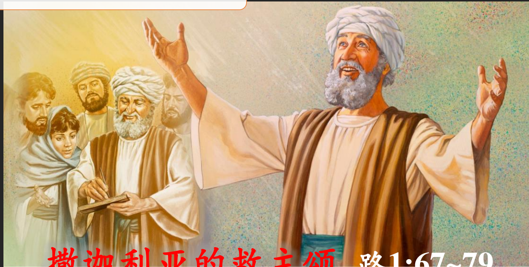
撒迦利亚的救主颂 路1:67~79