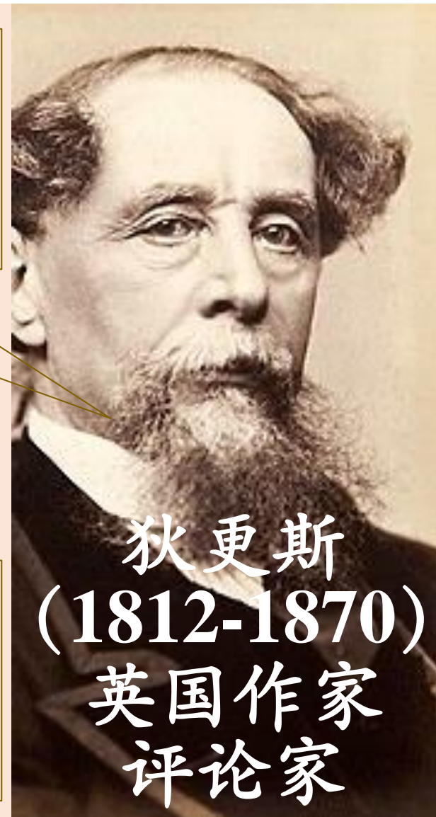
狄更斯 (1812-1870) 英国作家 评论家