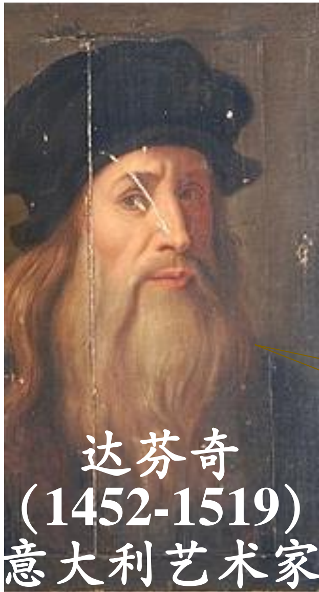
达芬奇 (1452-1519) 意大利艺术家