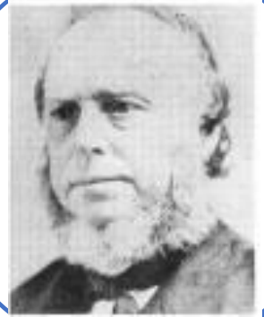
威廉·劳 牧师 William Law (1686-1761)