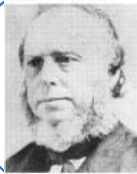
威廉·劳 牧师 William Law (1686-1761)

➤ 劳威廉牧师：“通往幸福及完美最近、最稳妥的捷径，就是为自己定下一条原则：凡事献上感谢和赞美神。若你为任何发生在你身上不幸之事，感谢赞美神，你就能将它变为上天的祝福……”