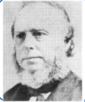
威廉·劳 牧师 William Law (1686-1761)